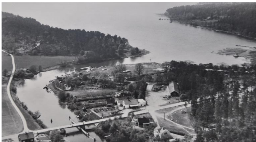
Flygfoto taget av Oscar Bladh över Flottsund och Fyrisåns utflöde i Ekoln

2010 har Sunnersta-Graneberg 1 livsmedelsbutik (Coop När), 1 mindre restaurang (utöver Skarholmen), några mindre butiker, 1 skola, många förskolor, ingen distriktssköterska, ingen poststation, ingen sopstation, ingen bensinstation, 1 kafé med deltidsöppet, 2 fotbollsplaner med 2 mindre servicebyggnader och 2 kyrkor.